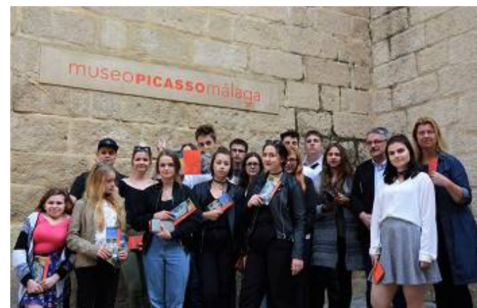
Wizyta w Muzeum Picassa