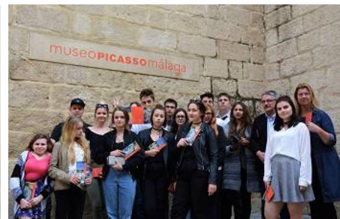
Wizyta w Muzeum Picassa